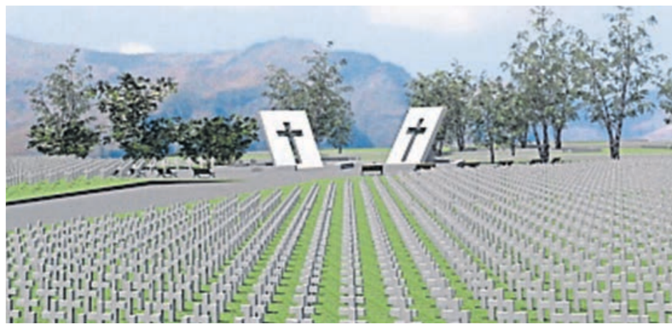
Projekcija groblja na Bilima: na svakome križu ispisat će se podaci o stradalima

- To je potpuno isti rukopis i isti akteri. Jedan od kamena temeljaca tog scenarija je svakako i nepotrebnost spomenimo Hrvata i Bošnjaka. Pokrenuli su ga oni koji nisu željeli prihvatiti tadašnja mirovna rješenja međunarodne zajednice. Tko su oni, bit će očitije ako znamo da je "bezbednjak" u jednom od korpusa Armije BiH 1993. bio osoba koja je 80-ih pokušala "disciplinirati" priču o ukazanju Gospe u Medugorju. Danas se preko tih konstrukcija Hrvate u BiH, koji su državljani EU, pokušava dodatno kompromitirati i držati podalje od te iste Unije. Istodobno nas se pokušava vezivati za određene euro-azijske geopolitičke političke saveze i vraćati nas u neke političke okvire za koje smo vjerovali da smo iz njih izašli 1992. Zbog toga nam je se uz Božju pomoć boriti da puna istina izađe na vidjelo i pravda konačno pobijedi. ●