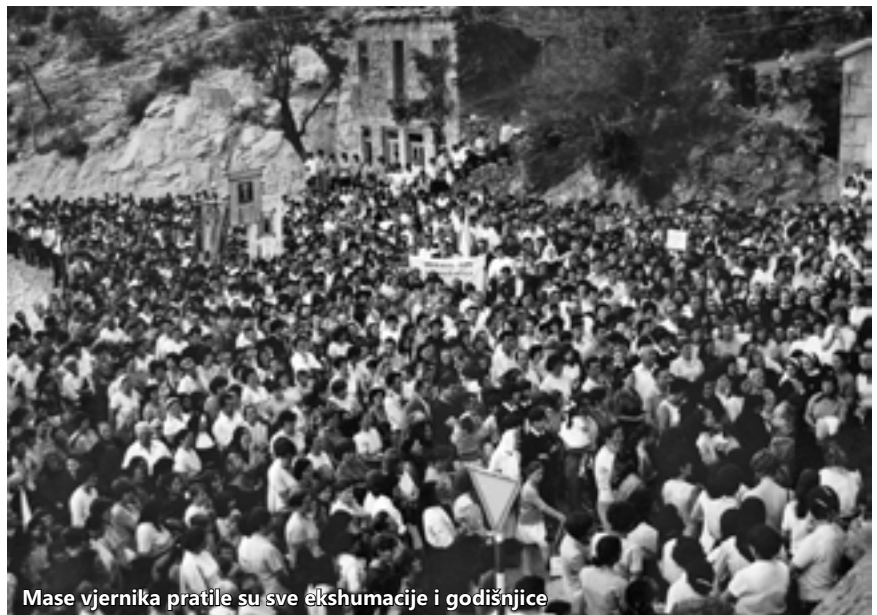
Mase vjernika pratile su sve ekshumacije i godišnjice