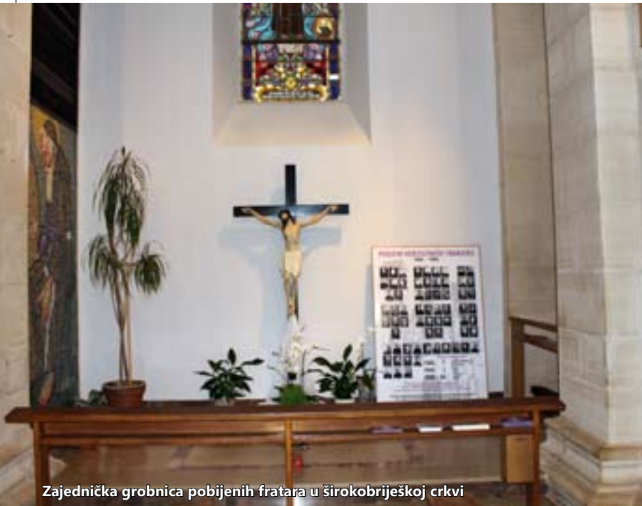
Zajednička grobnica pobijenih fratara u širokobriješkoj crkvi

No, nakon mjesec dana OZNA je saznala za to, provalila u sjedište Provincije u Mostaru i uništila sve što je našla. Neke su svjedoke zatvorili, a neke dobro prestrašili. I početkom 1947., kada je Drugi svjetski rat već bio završio, partizanski su komesari istjerali fratre iz samostana u Mostaru i zapalili sve ono što nije izgorjelo dvije godine ranije. Osim knjiga iz knjižnice, ovoga su puta spalili i matice koje su vođene od sredine XVIII. stoljeća. Ipak, unatoč svemu tomu, mi i danas imamo sačuvane neke originale svjedočanstva ljudi koji su bili ovdje dok se sve to događalo. Fratri su pokušavali zabilježiti sve što je bilo moguće. Jednostavno, mi fratri nismo se dali ušutkati i radili smo koliko smo mogli. S dolaskom slobode prišli smo sustavnomu istraživanju. Počeli smo s Povjerenstvom za pripremu kauze mučenika, 2006. godine imenovan je postulator u Rimu, a 2007. godine vicepostulator. Ta je služba povjereni meni, a poslao je još puno. Veliki je broj tih 66 fratara i za njih treba dosta vremena.