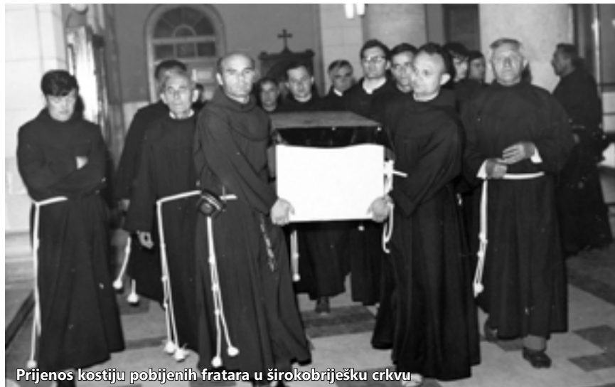
Prijenos kostiju pobijenih fratara u širokobriješku crkvu

Biskup mostarski Petar Čule odmah je poslao svoje suradnike kako bi ispitali što se dogodilo. Tako je već u travnju 1945. izvijestio nadležnu kongregaciju u Rimu o događanjima na Širokome Brijegu. Također je uspio doći i do nadbiskupa Alojzija Stepinca koji je bio glava Crkve u Hrvata. Biskupi su 20. rujna 1945. vjernicima napisali pismo, među ostalim, izričito spominjući ubojstvo hercegovačkih franjevaca. Čitavo to pismo strahovito je odjeknulo u komunističkim redovima te u inozemstvu. Početkom listopada biskup Čule Provinciji je dao poticaj da započne istraživanje svjedoka koji su pod prisegom morali reći što se sve dogodilo. Bio je to gotovo početak kauze.