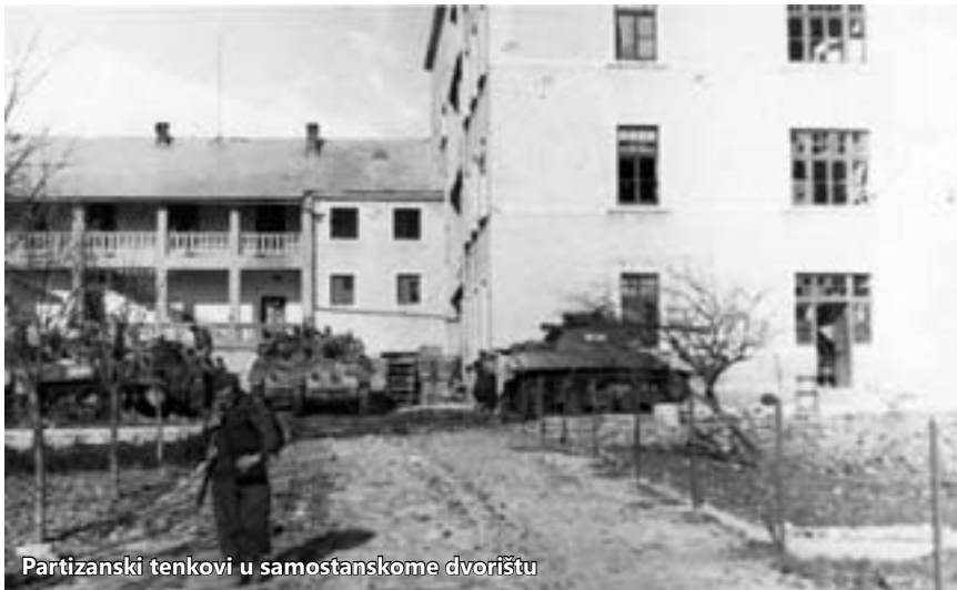
Partizanski tenkovi u samostanskome dvorištu

"Na području Mostara ofenzivne operacije naših snaga uspešno se nastavljaju. Naše trupe prodrle su u Široki Brijeg, gdje se vode ogorčene ulične borbe.